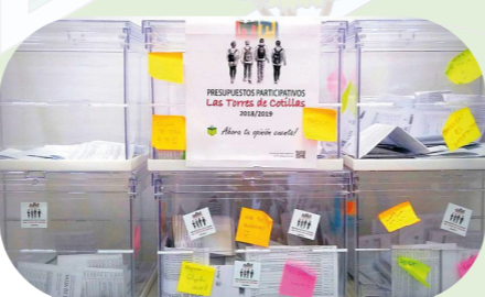
Urnas el día de la votación