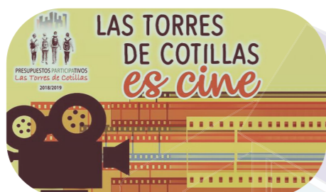
Ciclo "Las Torres de Cotillas es cine"

Durante los Presupuestos Participativos Jóvenes de Las Torres de Cotillas 2018 - 2019 , 645 jóvenes de secundaria, bachillerato y ciclos formativos han podido decidir en que invertir los 15.000 € destinados al proceso. Las propuestas más votadas han sido llevadas a cabo por el Ayuntamiento de Las Torres de Cotillas: