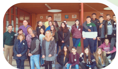
Día de la votación en los centros