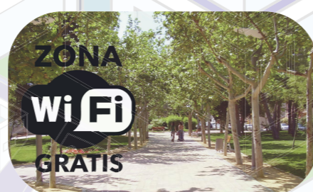
Wifi en el parque de la Constitución